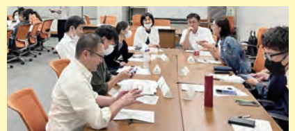
ケアリンピック実行委員会

すてきな景品がもらえるスタンプラリーなど、さまざまなプログラムがあります。ご来場、ご視聴お待ちしております!