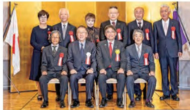
第32回産業功労者(敬称略)