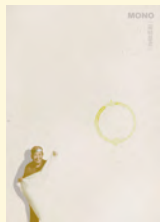
宣伝美術 | チャーハン・ラモーン