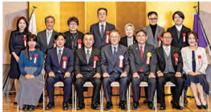
第39回技能功労者(敬称略)

永年にわたり同一の職業に従事し、技能の練磨や後進の育成に当たり、市民生活の向上に貢献された方を技能功労者として、農業・工業・商業の発展に多大な貢献をされた方を産業功労者として、隔年で表彰(今回は11月21日開催)しています▶ 問 ：産業振興課☎60-1832