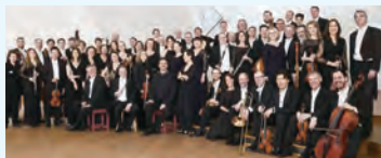
ゲルトナー・プラッツ劇場管弦楽団