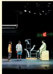
『仮想的な失調』(2024)