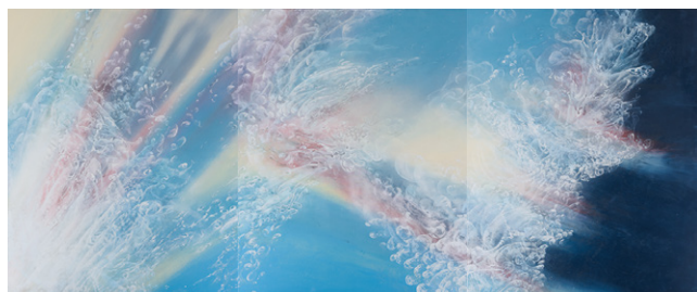
《水の空》2026年/162×390cm 岩絵具、アクリル/パネル、綿布