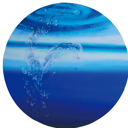
《浮-uku-》2016年/直径162cm 岩絵具、アクリル/パネル、綿布