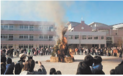
どんど焼きの様子

青少協は市立小学校の学区ごとに12の地区委員会が置かれ、青少年の健全育成を目的に、学校、関係団体、地域有志の方が活動しています。